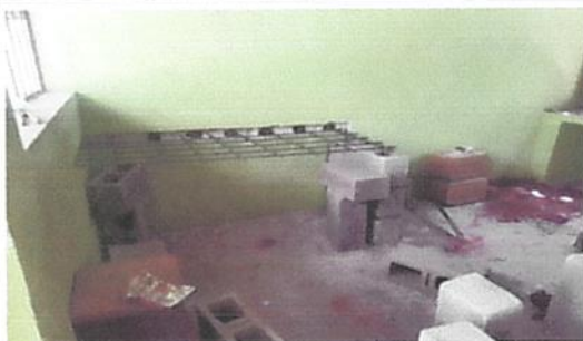
FABRICACION DE MESON DE CONCRETO DE 0.09 CMS DE ESPESOR INCLUYE AZULEJO