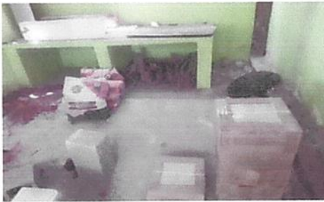
INSTALACION DE PISO CERAMICO EN COCINA