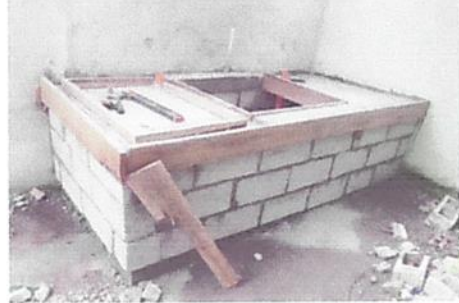
SUSTITUCION DE PILA E INSTALACION DE BOMBA DE AGUA