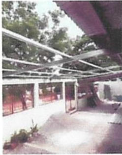
INSTALACION DE CANALES Y BAJADAS DE AGUA