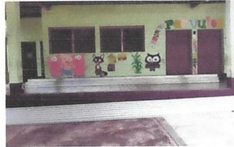
SUSTITUCION DE LAMINA EN SALON Y PATIO